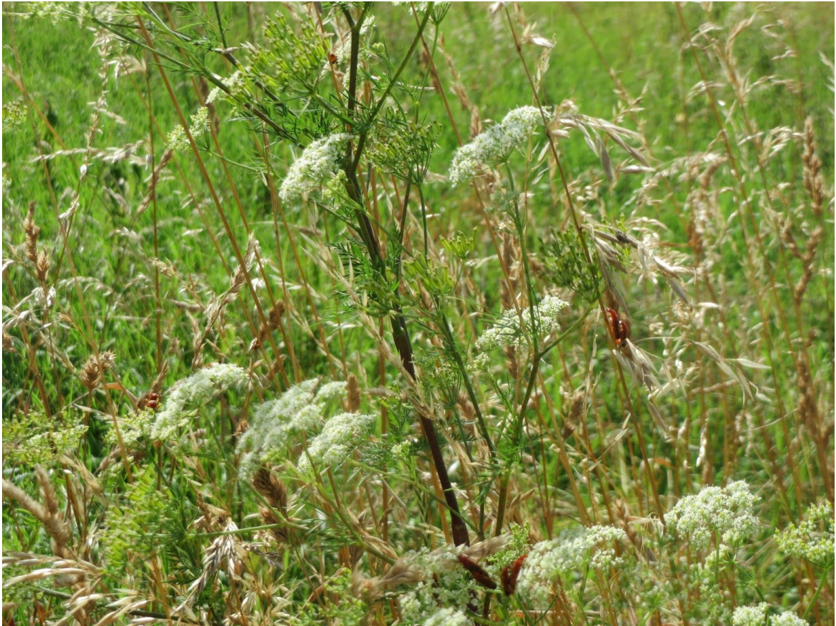
Kuva 1. Mukulakirveli ( Chaerophyllum bulbosum )

viimeisten parinkymmenen vuoden aikana, mikä tekee Lapinlahden esiintymien suojelemisen entistä tärkeämmäksi. (Liite 1).